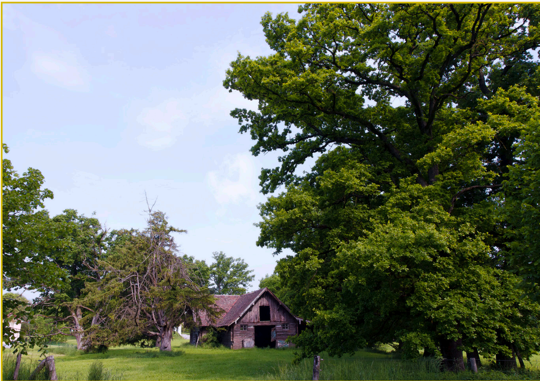
CARL PHILIPP STAMITZ (1745-1801) ~ SYMPHONY IN E-FLAT MAJOR